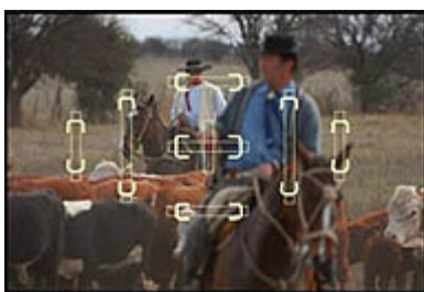
Mult-CAM 1000 (Nikon D80, D200)

Wer schon mal eine Dynax 7 im Einsatz hatte, weiß, dass auch Minolta Kameras mit schnellem Autofokus bauen konnte. Der Hersteller bewarb die Kamera damals als die schnellste überhaupt, und dürfte damit gar nicht so weit daneben gelegen haben. Nur leider wanderte der AF der Dynax 7 weder in die 7D oder 5D, noch in die \alpha 100 , denen der kraftvolle Motor sowie der treffsichere zentrale Doppel-Kreuzsensor ihrer analogen Ahnin fehlte. Sony hat jetzt endlich nachgebessert, der Autofokus der \alpha 700 hat wenig mit dem der 7D gemein. Während wir in der prallen Mittagssonne mit dem 2,8/300 spontan keine Geschwindigkeitsunterschiede feststellen konnten - das Dreihunderter ist derzeit eines von zwei Sony-Objektiven mit integriertem Ultraschallmotor zur Fokussierung, ein drittes soll im Frühjahr folgen - ist der Geschwindigkeitsvorteil bei allen übrigen Objektiven beträchtlich. Der AF der \alpha 700 packt schnell zu, der Antrieb arbeitet gleichzeitig auch leiser, sein Geräusch klingt etwas satter (das gleiche gilt übrigens für den Spiegelschlag: leiser und satter). Auch bei schlechten Lichtverhältnissen gab es kaum Probleme mit der Treffsicherheit.